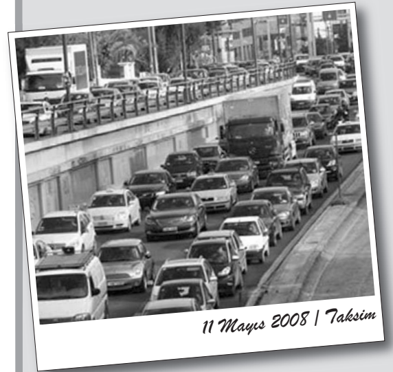
11 Mayıs 2008 | Taksim