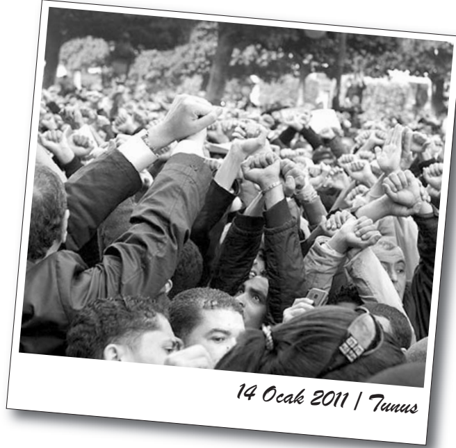
14 Ocak 2011 | Tunus

Fakat bu yine de düz bir süreç olarak ilerlemeyecektir. Çünkü kokuşmuş Bin Ali rejimine başkaldıran emekçiler büyük ölçüde durumun farkında. Büyük bedeller ödeyerek Bin Ali'yi kovduktan sonra onun koltuğuna yeni Bin Aliler'in geldiğini görüyor, bundan dolayı da sokakları terk etmiyor. Gösterilerde de bu bilincin bir ifadesi olarak “Diktatörlük partisi defol”, “Devrim devam ediyor. RCD defol” gibi sloganlar atılıyor. “Biz sahte demokrasi için isyan etmedik. Sahte muhaliflerle