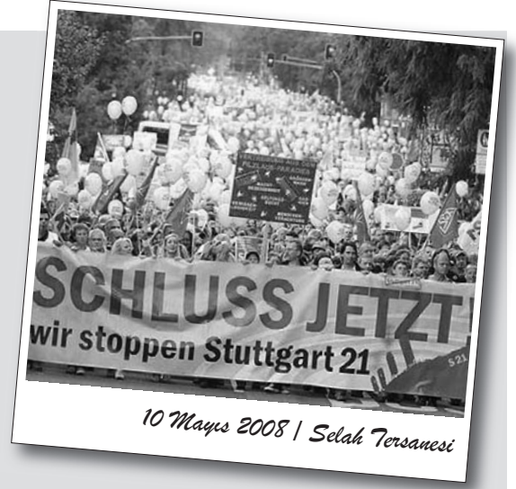
10 Mayıs 2008 | Selah Tersanesi

Kıbrıslı maliye emekçilerini BES olarak selamladıklarını söyleyen Biçer, "Mücadeleniz mücadelemizdir!" dedi.